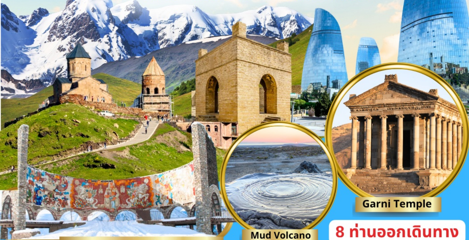
Georgia-Russia Friendship Monument