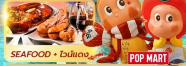
SEAFOOD + ไวน์แดง