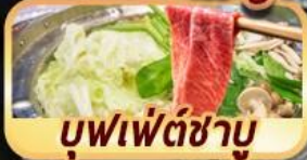
บุฟเฟต์ชาบู