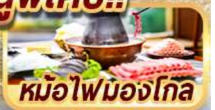
หม้อไฟมองโกล