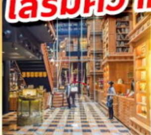
ร้านไอศกรีมมียาฮ่า