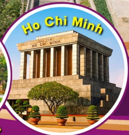
Ho Chi Minh