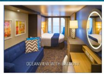
OCEANVIEW WITH BALCONY