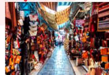
Tunis Old Medina