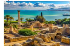
เมืองคาร์เจจ

17.15 น. ออกเดินทางสู่อิสตันบูล ประเทศตุรกี เที่ยวบิน TK664 22.10 น. เดินทางถึงสนามบินอิสตันบูล และเปลี่ยนเครื่อง