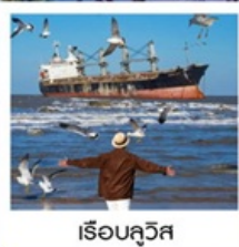
ริเอบลิวส์