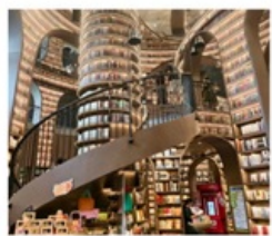
ร้านหนังสือจงซูก่อ

ศูนย์อนุรักษ์หมีแพนด้าดูเจียงเยียน (รวมรถแบดเตอร์) / ร้านหนังสือจงซูก่อ / จตุรัสหย่างเทียนวู / รูปปั้นหมีแพนด้าเซลฟี / เมืองโบราณกวันเซียน ที่ทำการไปรษณีย์หมีแพนด้า (PANDA POST) / ถนนคนเดินซุนซีลู่ / ห้าง IFS แพนด้าบิตติก / Chengdu Eastern Memory / ถนนคนเดินไท่กู่หลี่ / ห้าง SKP