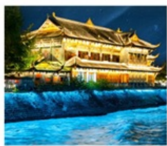
เมืองโบราณกวันเซียน