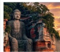
หลวงพ่อดเล่อซาน