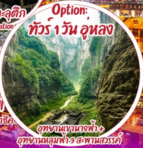
Option: ทัวร์ 1วัน อุนหลง