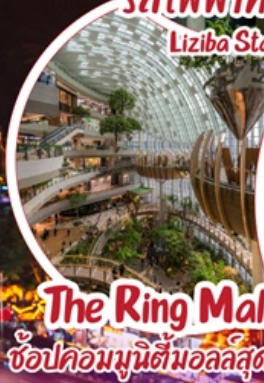
The Ring Mall