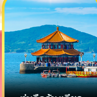
ท่าเรือจันเจียว