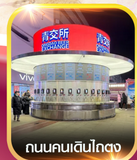
ถนนคนเดินโกตง