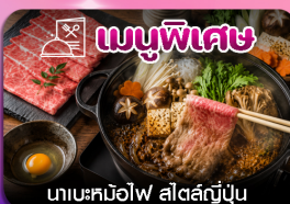
เมนูพิเศษ นาเบะคินอิโงะ สัตสึมันจู