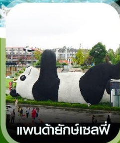
แพนด้ายักษ์เซลฟ์

คอนเฟิร์ม ออกเดินทาง ทุกพีเรียด 2 ท่านขึ้นไป