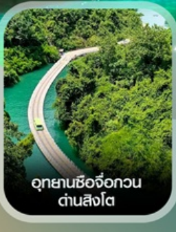
อุทยานชื่อจ้อกวน ด่านสิงโต