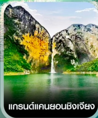
แกรนด์แคนยอนซิงเจี๋ย