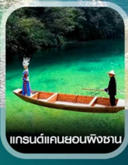
แกรนด์แคนยอนผิงชาน

คอนเฟิร์มออกเดินทาง ทุกพีเรียด 2 ท่านขึ้นไป