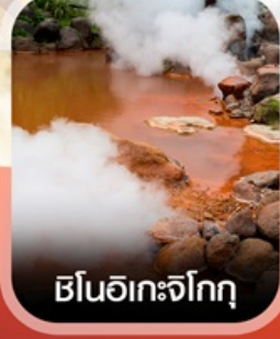
ชินอิเกะจิกุ