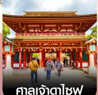
ศาลเจ้าตาไซฟุ