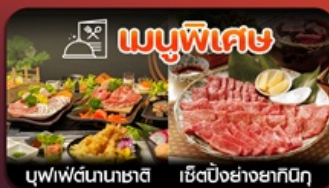
บุฟฟัดนาชาติ เชื้อตังย่างยากินุ

ฟุกุโอกะ-วัดนินโซอิน-หมู่บ้านยูฟูอิน-แบบบุ-บ่อนรกจิกุ-แช่ออนเซ็น-ช้อปิ้งเทนจิน-พักใกล้แหล่งช้อปิ้ง2คืน