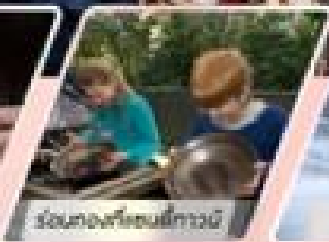
ร่วมท่องเที่ยวชมวิถีชีวิต