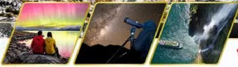
ตามล่าหาแสงใต้