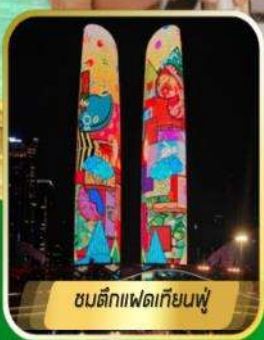
ชมตึกแพนด้าเทียนฟู่