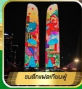
ชมตึกแฟลตเทียนฟู