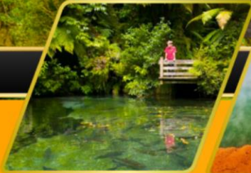
พาราไดซ์ สปริงส์ วอเตอร์เฟลล์