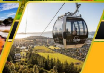
นั่งกระเช้าคอนโดล่าเมืองโรโตรัว