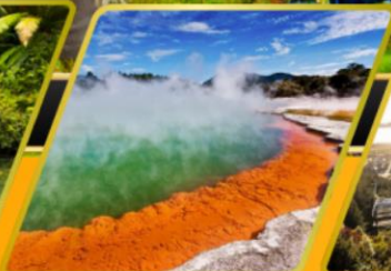
น้ำพุร้อน WAI-O-TAPU