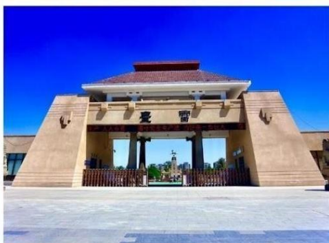
วัดเหลยไถ่ (Lintai Temple)