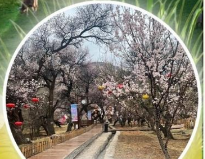
หุบเขาดอกแอปเปิ้ล