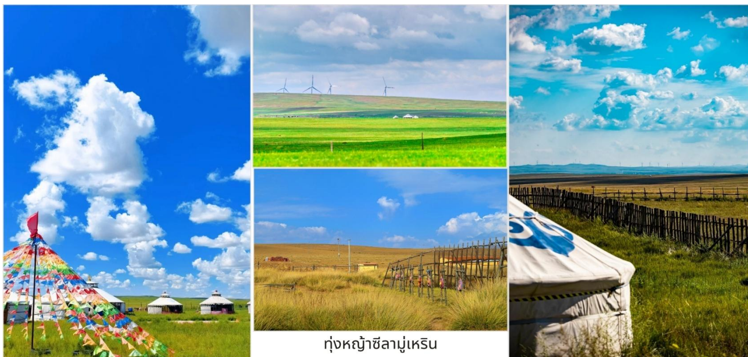
ทุ่งหญ้าซิลามูเหริน