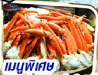
เมนูพิเศษ บุฟเฟ่ต์ชาบู 1 ชนิด