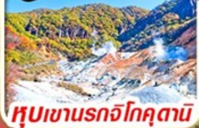
หุบเขานรกโจคุตานิ

รวม ค่าภาษีที่ปรับขึ้นแล้ว (ประกาศ 1 เม.ย. 69)