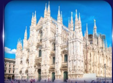
เข็ควินวิหารดูโอโม มิลาโน