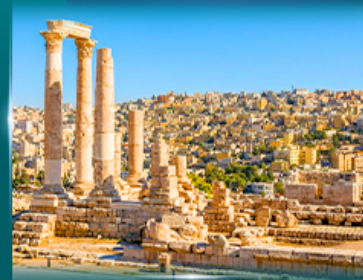
ปิ่อมปราการอัมมาน