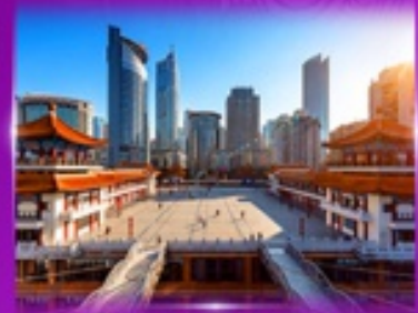
เซ็คอิน ตึกโค่วซังโห