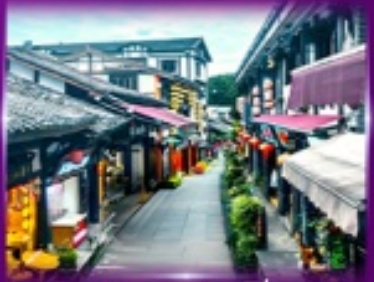
หมู่บ้านโบราณฉิวซีโ่ว