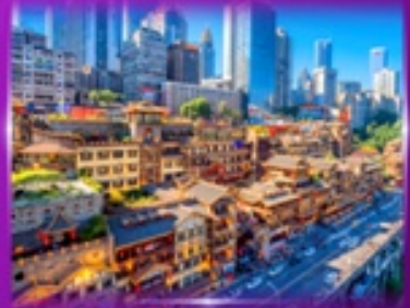
เซ็คอินย่านตึง หงหยาดัง