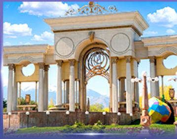
สวนสาธารณะประธานาธิบดี