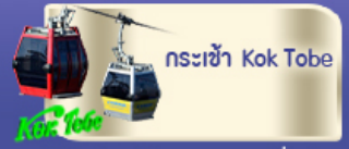
กระเช้า Kok Tobe