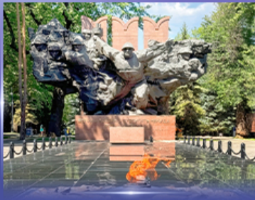
สวนสาธารณะ 28 Panfilov Park