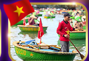
เรือกระด้ง หมู่บ้านกัมทาน