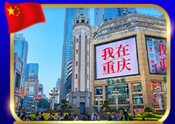
ถนนคนเดินริยฟางเป่ย