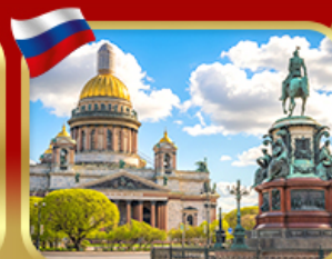
มหาวิทยาลัยเซนต์ไอแซค