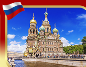
เข็ลอินโบสกแห่งหยดเลือด