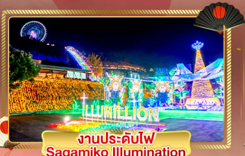
งานประดับไฟ Sagami Illumination