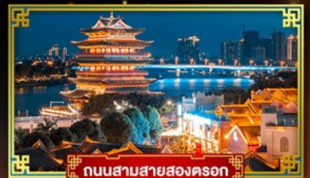
ถนนสามสายสองตอรอก