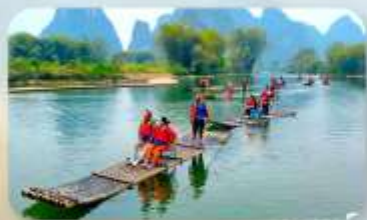
ล่องแพไม้ไผ่หยู่หลง