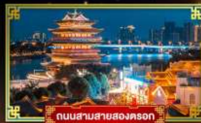
ถนนสามสายสองตอรอก