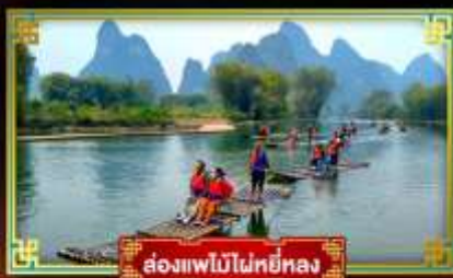
ล่องแพไม้ไผ่หยี่หลง