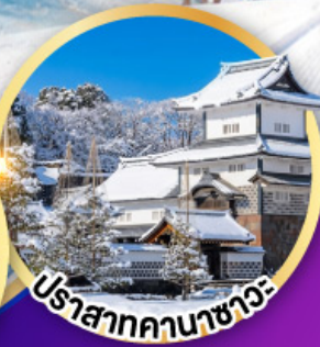
ปราสาทคานาซาว่า