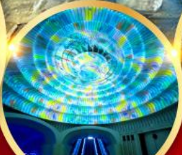
พิพิธภัณฑ์ศิลปะ MOA