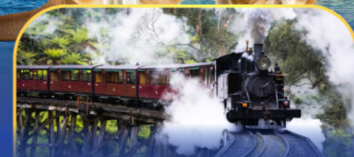
รถไฟฟฟิงบิลลี่

ล่องเรือชมอ่าวซิดนีย์พร้อมรับประทานอาหารกลางวัน และ เข้าชมสวนสัตว์การองก้า