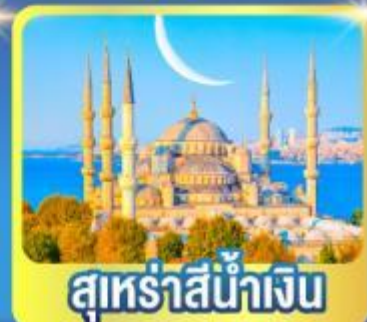
สุร่ายน้ำเงิน