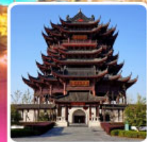
วัดหลงหยวน