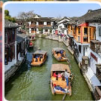
หมู่บ้านโบราณจูเจียวเจียว