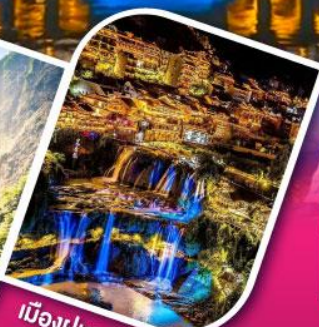
เมืองฝูหรงเจิ้น