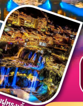
เมืองฝูหลงเจิน