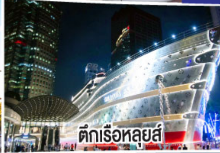
ตึกเรือหลุยส์