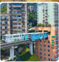
รถไฟทะเลตึก