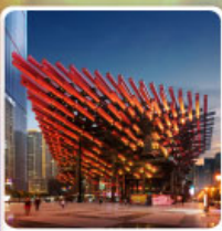
พิพิธภัณฑ์ศิลปะตะเกียบ