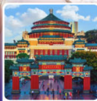
ศาลาประชาคมจงชิ่ง