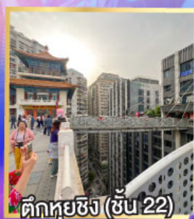
ตึกหุ่ยซิง (ชั้น 22)