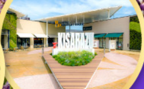
มิตซูเออิเกิ้ล พาร์ค คิซะระซู