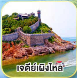
เจดีย์เฝิงไหล