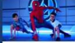
เหล่าซูเปอร์ฮีโร่และวายร้ายจากมาร์เวล