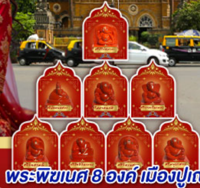
พระพิฆเนศ 8 องค์ เมืองปูเน่

" อินเดียครั้งนี้ ไม่ใช่แคร์ิป แต่คือการเปลี่ยนแปลง ปลุกพลังในตัวคุณ... ด้วยพิธีกรรมศักดิ์สิทธิ์ ณ สถานที่จริง ของพระพิฆเนศ ดินแดนแห่งปัญญาและพรสูงสุด"