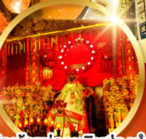
วัดเจ้าแม่กวนอิมฮองฮำ (สวนหนานเท่ลิย)