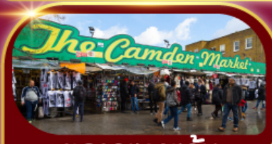
ตลาดแคมเดน