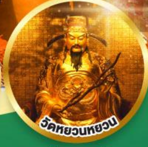
วัดหยวนหยวน

ขอพรเรื่องสุขภาพ, โชคลาภ ความเจริญก้าวหน้า