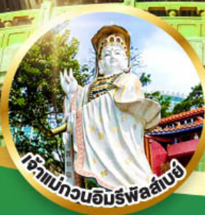
เจ้าแม่กวนอิมพรหมสันติ