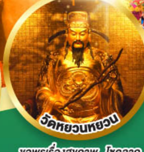
วัดหยวนทวยวน

ขอพรเรื่องสุขภาพ, โชคลาภ ความเจริญก้าวหน้า