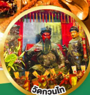
วัดกวนโก