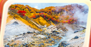
เขมเขานรกจิโศดามิ